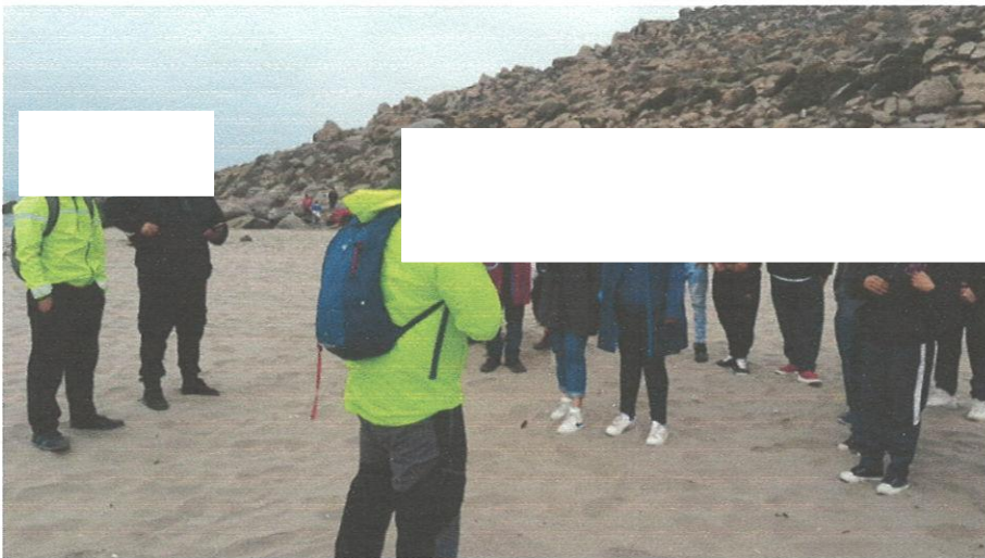
11 de diciembre: Jornada recreativa complejo Borde Rio coleo Villa San Bartolomé.