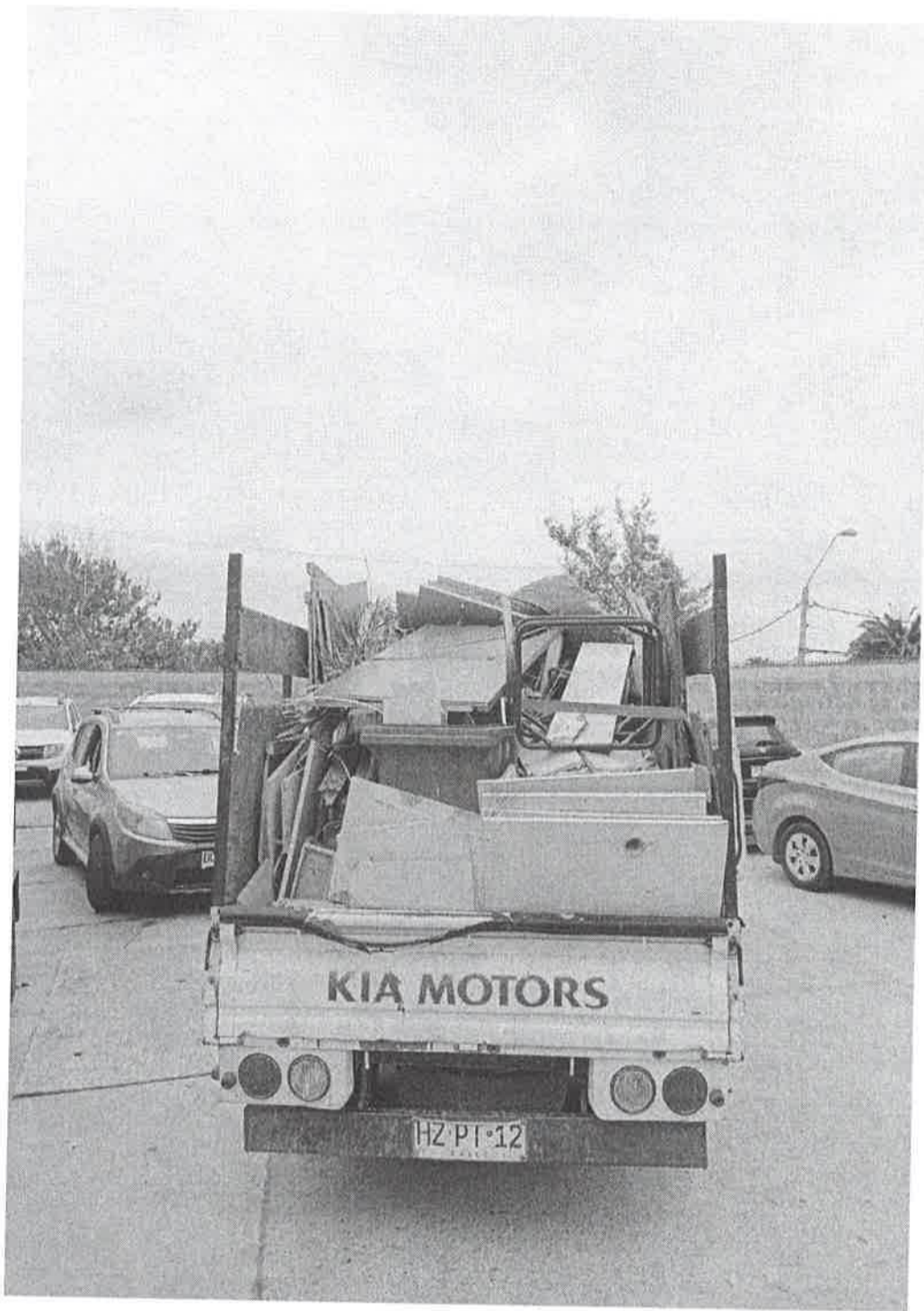
Departamento de Educación - Corporación Municipal Gabriel González Videla.